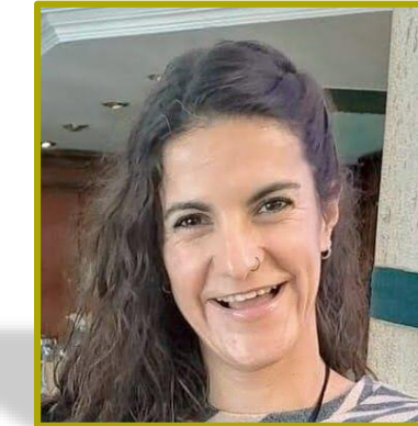
Coordinadora de las AATT Madrid